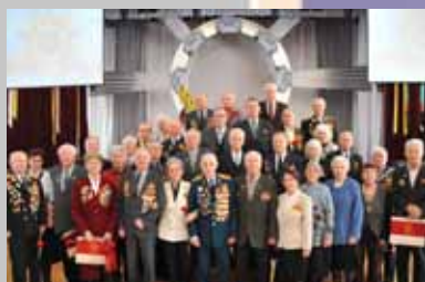
Конференция в честь 65-летия Победы