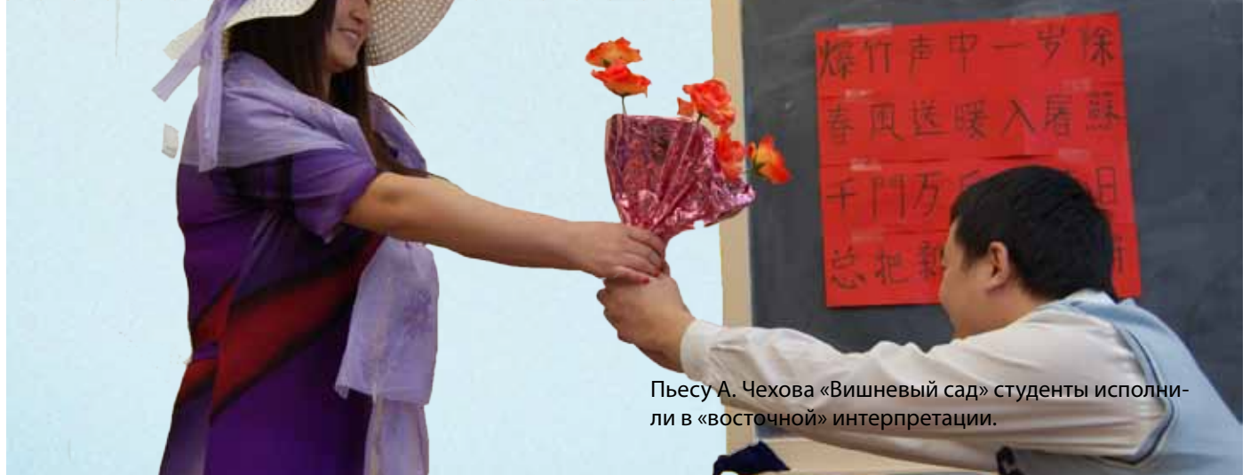
Пьесу А. Чехова «Вишневый сад» студенты исполнили в «восточной» интерпретации.