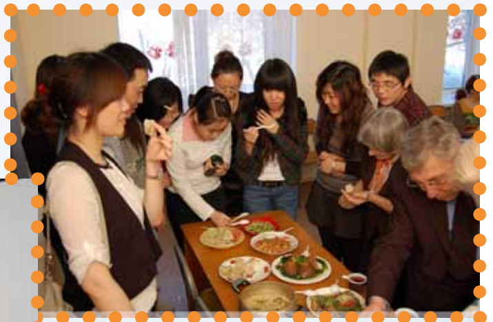
Студенты и их гости за интернациональным новогодним столом.

Александр Владимиров, Пресс-центр ТОГУ.