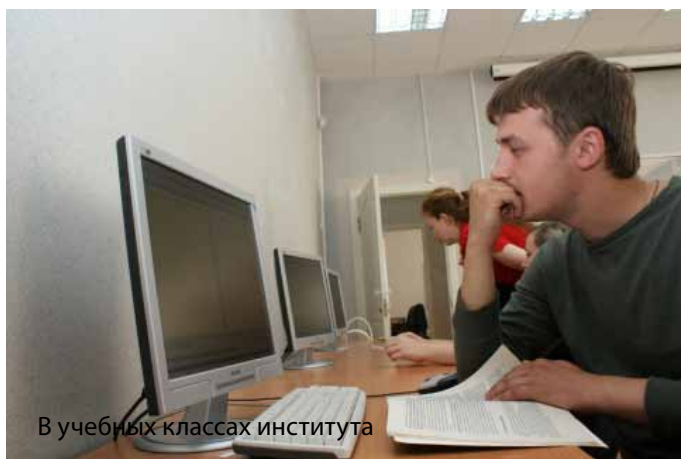
В учебных классах института

Учебный процесс в ИЭУ – это удачное сочетание лучших традиций, накопленных вузом за десятилетия, и инноватики, это творческий синтез классической науки, современных (в том числе и компьютерных) технологий обучения и практической апробации полученных знаний в условиях современного бизнеса. Обучение студентов ИЭУ организовано на базе пяти компьютерных классов и специализированных лабораторий. Теоретические знания студенты закрепляют в период летних учебных и производственных практик в ведущих организациях и на предприятиях не только Хабаровского края, но и всего Дальневосточного региона. Руководители и авторитетные специалисты из научно-исследовательских организаций, крупных банков, предприятий различных отраслей народного хозяйства приглашаются кафедра-