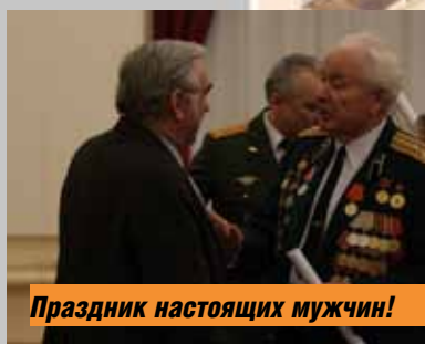
Праздник настоящих мужчин!