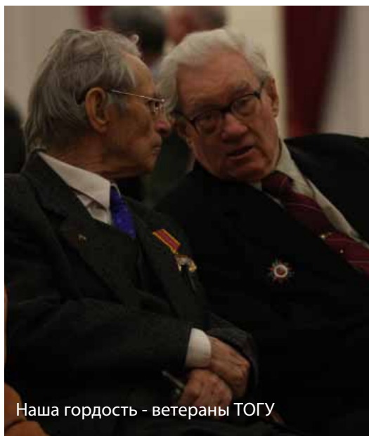
Наша гордость - ветераны ТОГУ

А завершилось праздничное мероприятие видеопредставлением команд институтов и факультетов, участвовавших в оборонно-спортивном конкурсе в честь Дня защитника Отечества, проведением последних конкурсных этапов и подведением его итогов. Первое место в конкурсе, как выяснилось после подсчета общего количества баллов за все этапы, заняла команда Института Экономики и Управления ТОГУ.