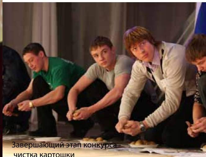
Завершающий этап конкурса - чистка картошки

Пресс-центр ТОГУ. Фото Александра Гайворона