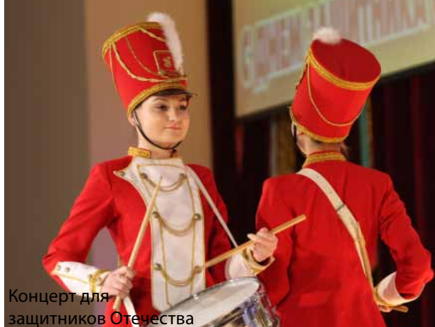
Концерт для защитников Отечества