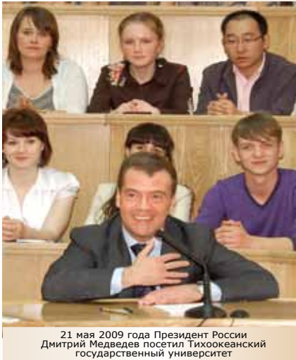
21 мая 2009 года Президент России Дмитрий Медведев посетил Тихоокеанский государственный университет