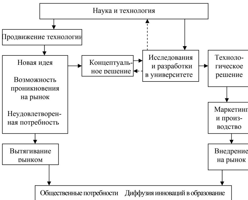
Рис. 1. Модель инновационного процесса в системе образования

Инновационный процесс представляет собой процесс создания и обязательного внедрения в практику социума нововведений (инноваций). В общем виде модель инновационного процесса может быть представлена следующим образом (рис. 1).