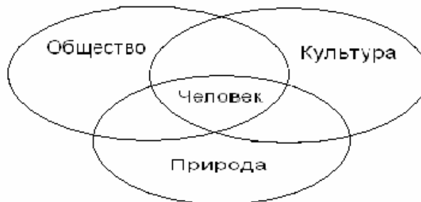
Рис. 1. Структура бытия (по М. С. Кагану)

Метасистемой (системой систем) является, согласно М. С. Кагану, бытие во всей полноте этого исходного философского понятия. Природа есть наличное бытие материи, общество же выступает как внебиологический способ связи людей в их совместной жизни и деятельности. Человек предстает сложной трехсторонней системой – биосоциокультурной, центральным «звеном» в цепи основных форм бытия, деятельным и наделенным сознанием существом. Культура представляет собой инобытие человека, «вторую», созданную им природу (все более теснящую первую, становящуюся новой средой существования человека), совокупность материальных, духовных, художественных артефактов, выступающих в качестве особого механизма «социального наследования» [2].