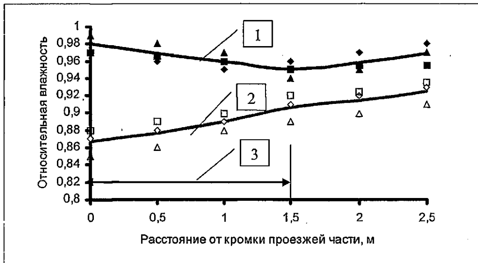
Рис. 2. Графики распределения влажности грунта на глубине 0,5 м от поверхности обочины:

Отбор проб грунта для определения влажности осуществлялся в трех точках под обочиной через 0,5 м по глубине. В поперечнике отбор проб осуществлялся в шести точках от кромки проезжей части через 0,5 м. Графики распределения влажности в характерном сечении грунта приведены на рис. 2.