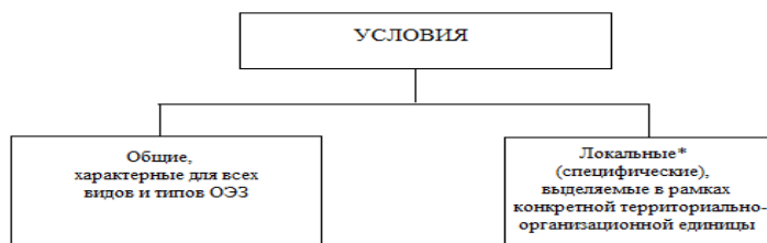
Рис. 1. Общая схема классификации условий, оказывающих влияние на эффективное функционирование особых экономических зон

На основании вышеперечисленных классификаций факторов и условий, оказывающих влияние на эффективное функционирование особых экономических зон, сформируем свою классификацию. Для начала представим классификацию условий, способствующих формированию и развитию ОЭЗ (см. рис. 1).